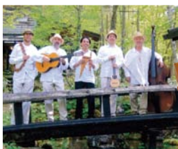
アンデスグループ「WAYNO」

中国古箏演奏家。上海音楽学校を首席で卒業。独自の音楽世界を展開している。日本では、ラジオ番組などメディアでも幅広く活躍中。