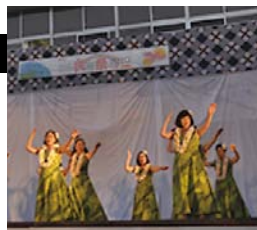
▲紀美野ハワイアンフラ

お米でアジアをつなぎましょう! 라이스로 아시아를 연결합니다! 用大米连接亚洲吧!