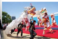
大阪府立成美高等学校 (中国文化春晩倶楽部)